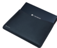
dynabook-Hülle, 15" (PX1911E-1NCA)