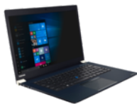
Sichtschutzfilter (selbsthaftend) (PX1905E-2NAC)