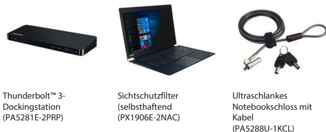
Thunderbolt™ 3-Dockingstation (PA5281E-2PRP)